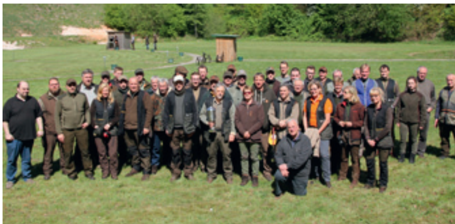
Teilnehmerinnen und Teilnehmer Kreismeisterschaft 2019

Die Ergebnisse der Einzelwertung sind unter nachfolgendem Link einzusehen. https://www.jaegerschaft-zeven.de/wild-und-jagd/jagdliches-schiessen/