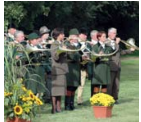
In der LjN sind derzeit über 365 Bläsergruppen organisiert

Im Barock kam die feudale Parforce-Reitjagd hinter der Hundemeute in Mode und erlebte ihre Blütezeit an den absolutistischen französischen Königshöfen, insbesondere unter Ludwig XIV. und XV. Das Jagdhorn dieser höfischen Jagd des 17. und 18. Jahrhunderts war das Parforcehorn (meist in D oder Es), für welches eine Vielfalt von Signalen, Fanfaren und Jagdmusiken überliefert ist. Hier ist besonders der Marquis de Dampierre, Jägermeister Ludwigs XV., zu nennen, der eine große Zahl von heute noch gebräuchlichen Kompositionen hinterlassen hat. Die Parforcehörner wurden an den deutschen und böhmischen Fürstenhöfen ebenfalls eingeführt und später auch zum Orchesterinstrument weiterentwickelt; ihre Bedeutung als Gebrauchsinstrumente verloren sie im deutschen Raum jedoch mit der Revolution von 1848 und dem damit verbundenen Ende der Feudal-jagd. Erst mehr als 100 Jahre später erlebte die Tradition des „großen“ Naturhornes eine Renaissance in Deutschland. Innerhalb der Landesjägerschaft Niedersachsen widmen sich heute über 30 Bläsergruppen intensiv dem Es-Horn und studieren traditionelle Fanfaren sowie eigens komponierte Vortragsstücke ein. Zunehmender Beliebtheit erfreuen sich die alljährlich um den 3. November (Hubertustag) herum begangenen feierlichen Hubertusmessen und Jänergottesdienste, bei denen die liturgischen Elemente von den Hörnern gestaltet werden.