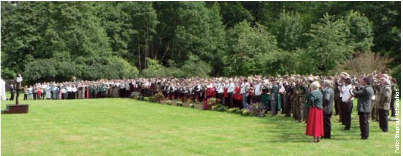
Jagdliche Öffentlichkeitsarbeit ist ohne die Jagdhornbläser nicht mehr denkbar