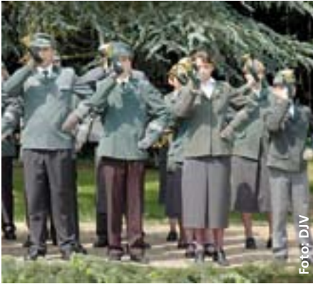
Auch bundesweit erreichen die niedersächsischen Jagdhornbläser regelmäßig gute Platzierungen

Vortragen zweier selbst gewählter Stücke aus dem Repertoire von Jägermärschen und Fanfaren